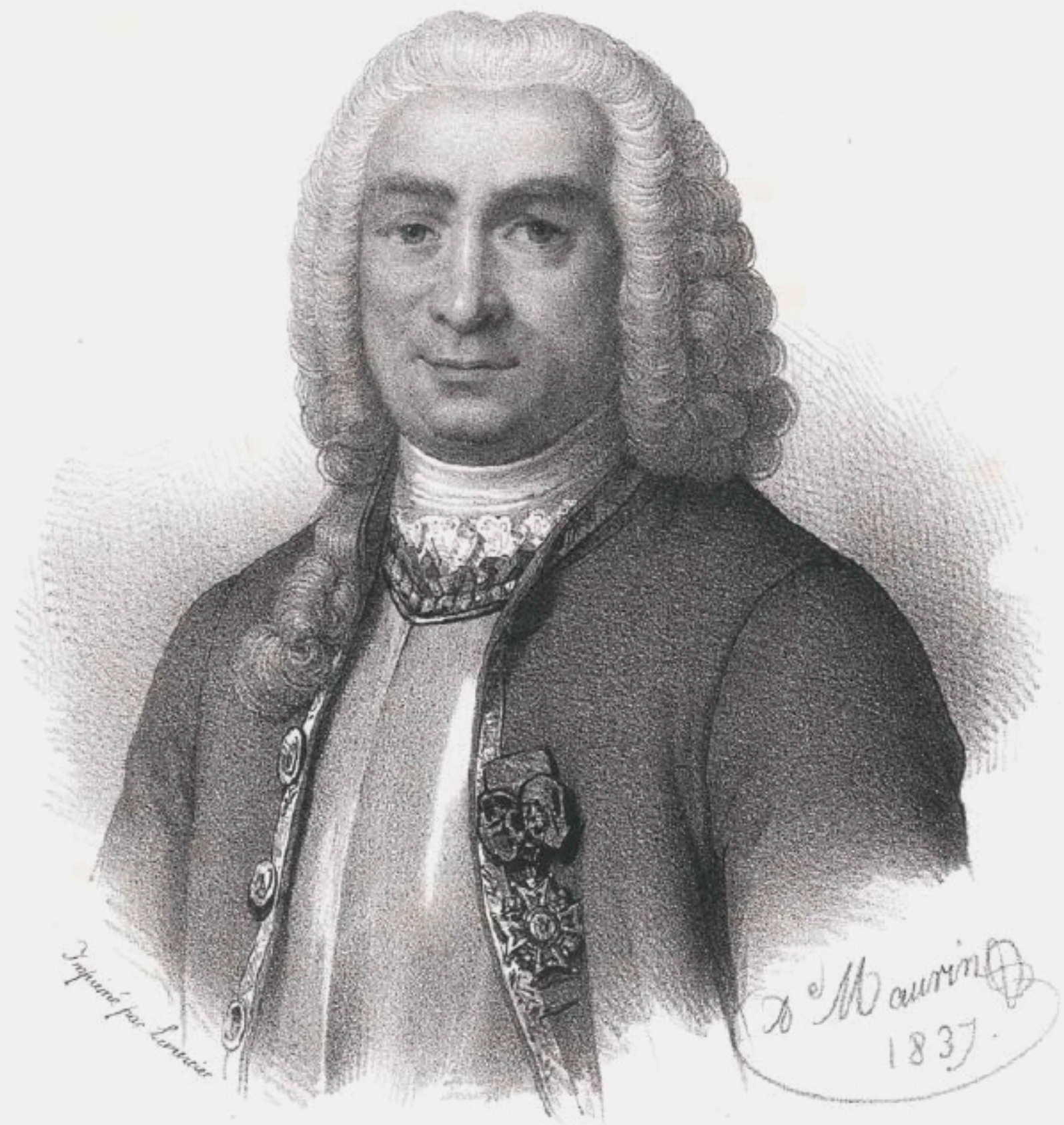
MAHÉ DE LA BOURDONNAIS.

CI-CONTRE : Portrait de Bertrand François Mahé de La Bourdonnais né à Saint-Malo le 11 février 1699. Dès l'âge de 10 ans il est enrôlé dans la marine au service de la Compagnie des Indes. À 19 ans il est promu lieutenant, puis à 24 ans capitaine. En 1735, il est nommé gouverneur des îles de France (île Maurice) et de Bourbon (la Réunion) et prend ses fonctions à l'âge de 36 ans. Infatigable, il met sur pied à Port-Louis les structures nécessaires pour y fonder une véritable colonie qui devient alors une importante base navale. En 1740, il est nommé capitaine de frégate et reçoit la croix de Saint-Louis. Début 1746, il est chef d'escadre de neuf bâtiments et, de l'île de France, il se porte au secours de Duplex, gouverneur de Pondichéry, alors menacé par les Anglais. C'est en septembre de cette même année qu'il fait le siège et la conquête de Madras (aujourd'hui Chennai), place forte des Anglais aux Indes. C'est le début d'un interminable conflit avec Duplex sur la destinée de la ville de Madras. La Bourdonnais est alors injustement destitué de son poste de gouverneur à l'île de France et retourne à Paris où il est immédiatement embastillé en 1748. Voltaire prend officiellement sa défense. Après un procès retentissant, le tribunal le déclare innocent et il est libéré en 1751. Amaigri, épuisé et malade, il meurt le 10 novembre 1753. Gravure de Maurin, Paris, 1837.