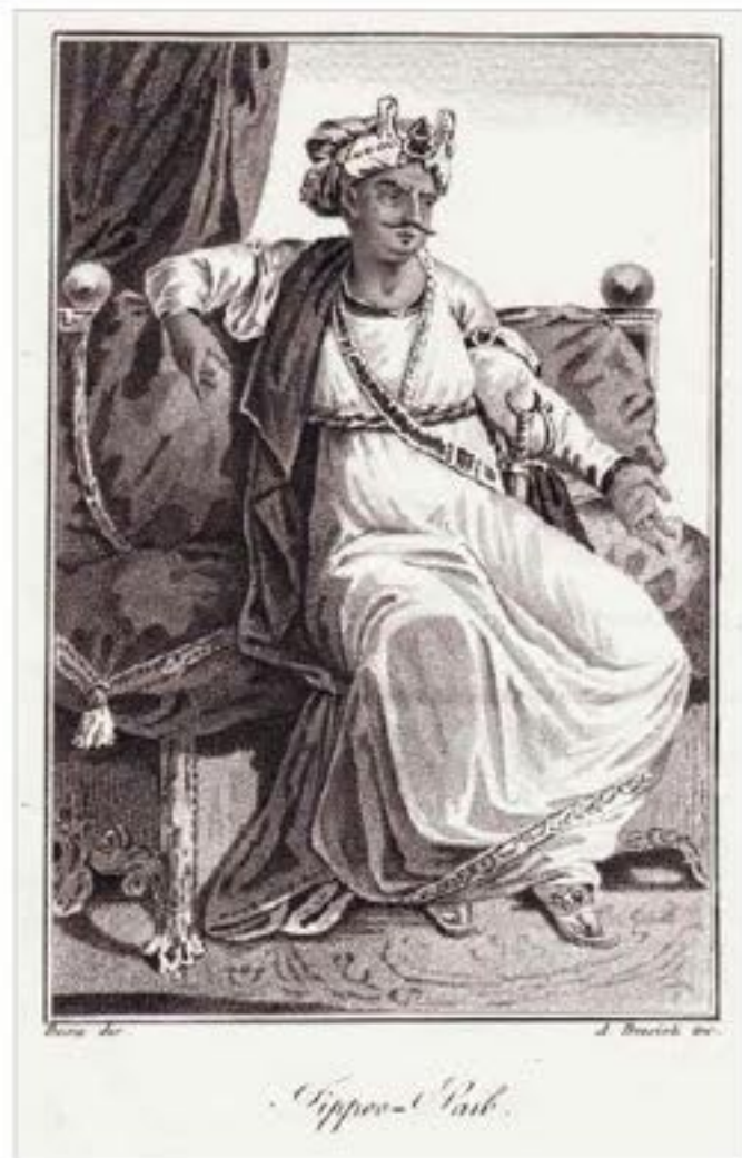
CI-DESSUS, À GAUCHE : Tipou Sultan dans son palais de Seringapatam.